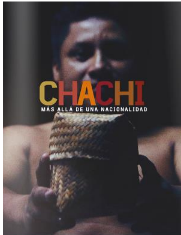
Portada de la Propuesta del Libro

Enlace: http://issuu.com/otto.sanchez/docs/tesis_libro